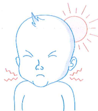
Вкочанет врат, осетливост на светлост 2