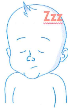
Поспаност, малаксалост, не реагира на дразби 2