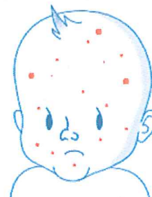
Бледа, прошарана кожа; дамки/осип 2

НЕ ЧЕКАЈТЕ ПОЈАВА НА ОСИП БИДЕЈЌИ ИСТИОТ НЕ МОРА ДА СЕ ПОЈАВИ. 2,3 АКО СЕ ПОЈАВИ НЕКОЈ ЗНАК ИЛИ СИМПТОМ, ВЕДНАШ ПОБАРАЈТЕ МЕДИЦИНСКА ПОМОШ.