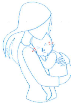
Нервоза, допирање му е нелагодно 2