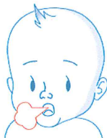
Забрзано дишење или стенкање при дишење 2