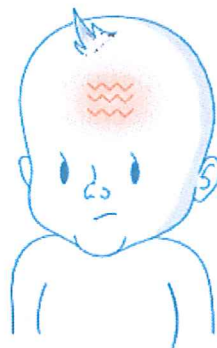
Напната, испакната фонтанела (мека точка на главата) 2