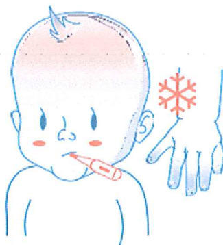
Треска, ладни раце и стапала 2