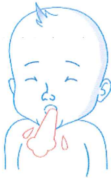
Одбивање храна и повраќање 2