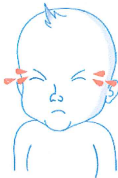
Невообичаено плачење, јаукање 2