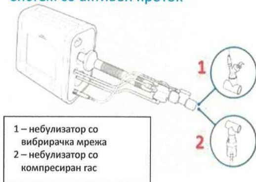
Active Flow Circuit Систем со активен проток