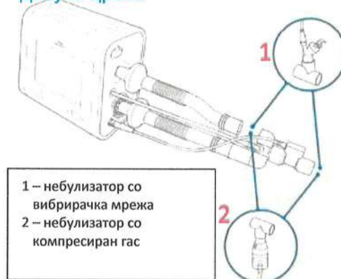
Систем со двојно црево